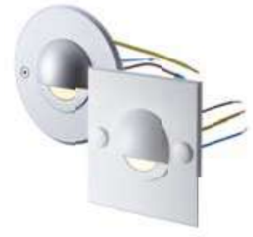
Alu eloxiert und weiß beschichtet anodised aluminum and coated white aluminium éloxé et laqué blanc