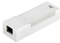
40168 - Convertisseur IP/2 fils pour caméras