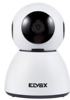
46239.040A - Cam. PT Wi-Fi Full-HD 1080p 4mm