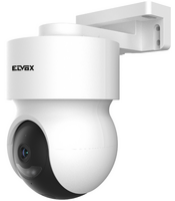
46241.030B - Cam. extér. PT Wi-Fi 1080p 3mm