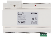
40105 - Alimentation DIN 100-240V~ 50/60Hz 32Vdc