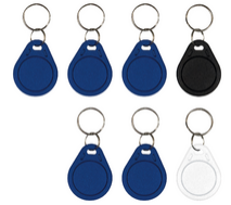
40169 - 7 clés RFID Mifare