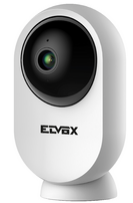
46239.036C - Cam. PT Wi-Fi 3Mpx 3,6mm vision 110°