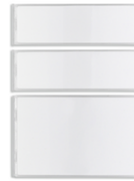
42920.K - Kit 1-2-4 boutons plaque kit vidéo RFID