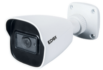
4621.2812BA - Cam. Bullet IP IR 2Mpx 2,8-12mm A.V.