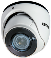
4622.2812BA - Cam. Dome IR IP 2Mpx 2,8-12mm Mic A.V.