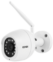
46237.040A - Cam. Bullet Wi- Fi Full-HD 1080p 4mm