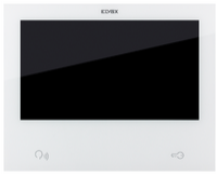
40980.M - Moniteur TS 7in Wi-Fi IP/2 fils