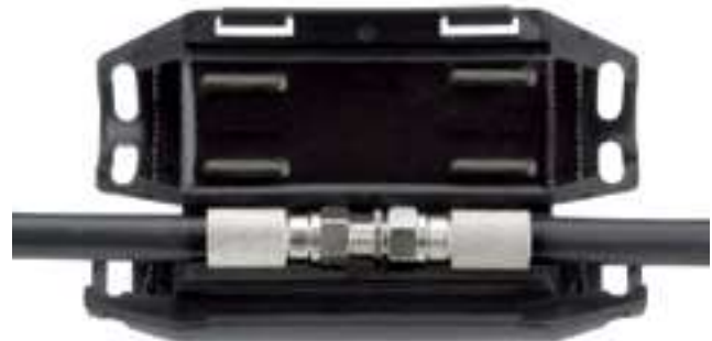
Typ GTQT K 1