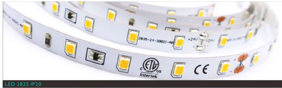
LED 2835 IP20