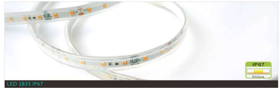
LED 2835 IP67