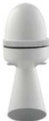
SEM SEM PLUS