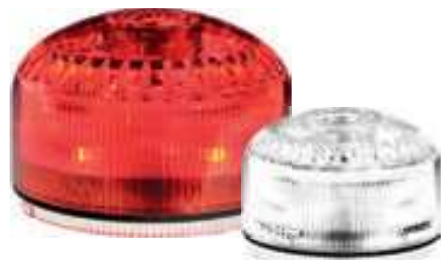
SIR-E LED FA