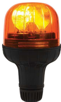
ROTATOR FLEXI BASE FLESSIBILE ISO A (fissaggio su spinotto) FLEXIBLE ISO A BASE (mount on adapter socket) BASE FLEXIBLE ISO A (emboîtement sur prises de connexion)